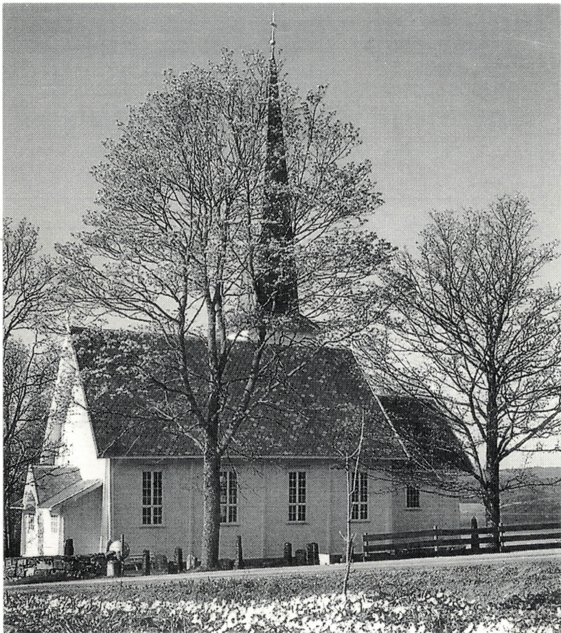
Nordlien kirke, Østre Toten Se artikkel side 200

Nr. 3/4 2001 Årgang 19 Pris kr. 40,- ISSN:0802-860